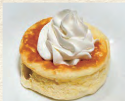
クラシックパンケーキ