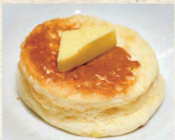
プレーンパンケーキ