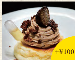
マンズリーパンケーキ