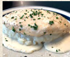
ホワイトソース オムライス