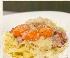
黄身のカルボナーラ フィットチーネ