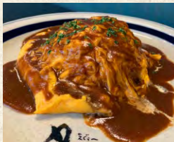
半熟オムライス (デミグラスソースがけ)