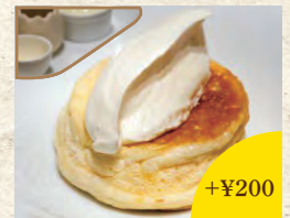
プレミアムパンケーキ