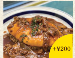
マンズリー オムライス