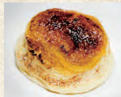
ブリュレパンケーキ