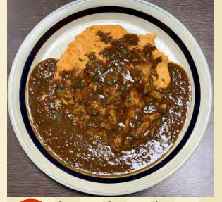
d カレーオムライス ¥930 h 【大盛：¥1080】