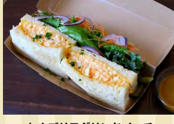
m たまごサラダサンドイッチ ¥530