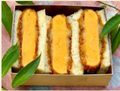
j 卵カツサンドイッチ ¥450