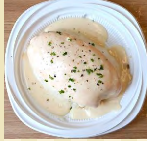
c ホワイトソースオムライス ¥930 g 【大盛：¥1080】