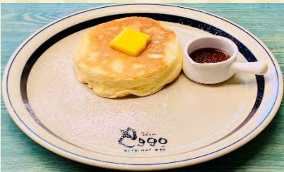
s プレーン1枚 ¥480