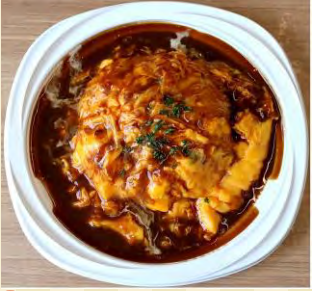
a デミグラスオムライス ¥930 e 【大盛：¥1080】