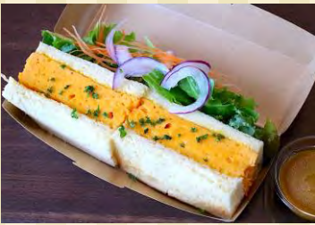
l オムレツサンドイッチ ¥550