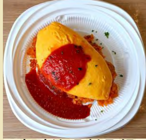
b トマトソースオムライス ¥850 f 【大盛：¥1000】