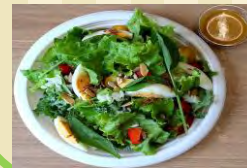
q eggg サラダ大 ¥900