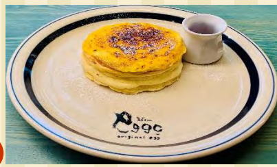
t フリュレ1枚 ¥670