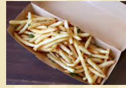
n カリカリポテトフライ ¥500