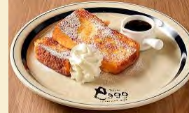
u プレーン ¥850