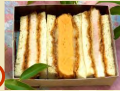
k ロースカツ・卵カツサンドイッチ ¥750