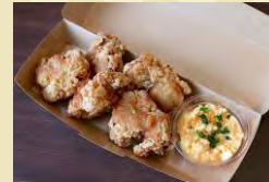
p 唐揚げ(たまごサラダ付き) ¥630