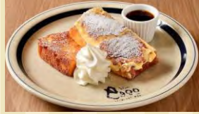
v フリュレ ¥1000